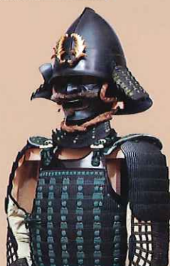
百穂塗前巻糸威二枚胴具足 (公益財団法人鍋島報効会所蔵)

初代佐賀藩主鍋島勝茂公の嫡男忠直公の早世により、2代藩主はその子光茂公が継ぎました。忠直公以外の息子たちの多くは分家を創設し、姫君は藩内の重臣家に嫁ぎました。平成29年が最初の分家である小城鍋島家の創設から400年にあたるのを機に、初代藩主による一門の創設を中心とした藩政運営の基盤づくりをたどります。