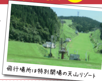
飛行場所は特別開場の天山リゾート