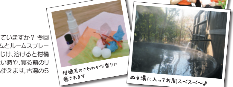
柑橘系のさわやかな香りに癒されます ぬる湯に入ってお肌スベスベ~♪

古湯温泉に、アロマセラピスト(芳香療法士)の女将たちがいるのを知っていますか? 今回は、オリジナルブレンドアロマ「幸せのしずく」を使って、女将自らバスボムとルームスプレー作りを特別伝授! バスボムは、お風呂に入れるとシュワシュワツとはじけ、溶けると柑橘系の香りが広がります。また、ルームスプレーは、気分をリフレッシュしたい時や、寝る前のリラックスタイムなど精神的な目的だけでなく、消臭など実用的な面でも使えます。古湯の5つの温泉旅館の無料入浴券付き。ぬる湯効果でお肌もスベスベに♪