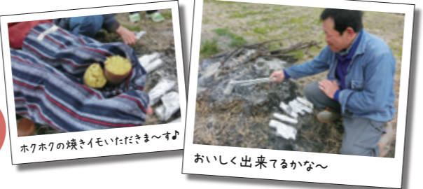
ホクホクの焼きイモいただきます! おいしく出来るかな~

11月は、サツマイモ掘り体験と焼きイモ作りができます。収穫から焼きイモ作りまで一度に楽しめる欲張りなプランです。