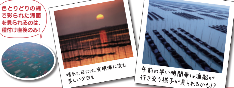
色とりどりの網で彩られた海面を見られるのは、種付け直後のみ! 晴れた日には、有明海に沈む美しい夕日も 午前早い時間帯は漁船が行き交う様子が見られるかも!

九州各地で遊覧飛行を実施している「佐賀航空」から、佐賀ならではの遊覧飛行をご提案! 日本一の海苔のふるさと「有明海」では、10月中旬から11月の「種付け」(ノリの胞子をつけたカキ殻を養殖用の網につけて、25~30枚重ね、海中に立てた支柱に結んで海に浮かべる作業)が始まります。漁場いっぱいに広がる海苔網を空から見る特別プラン!