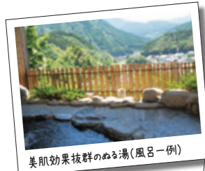
美肌効果抜群のぬる湯(風呂一例)

佐賀市北部に位置する古湯・熊の川温泉郷は、ぬるめのお湯とぬるめるとした肌ざわりから「ぬる湯」と呼ばれ、親しまれています。この温泉と会席料理をセットにしたプランです。定員に限りがありますので、お早めにご予約ください。