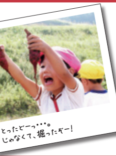
とったてっ...じやなくて、掘ったてっ...