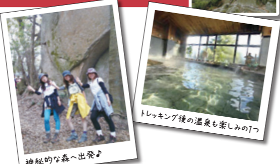
神秘的な森へ出発♪ トレッキング後の温泉も楽しみの一つ

10mを超える巨石群が17基点在する、神秘的な森を巡ります。巨石パークを熟知した「山桜の会」によるガイドで、初めての人も安心! 興止女神社の御神体と言われる巨石群の話聞きながら、パワー溢れる空気を思いっきり浴びよう! 参加者には、ホテル龍登園の入浴割引券をプレゼント。天然温泉で汗を流して、心も体もリフレッシュ!