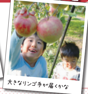
大きなリンゴ手が届かない