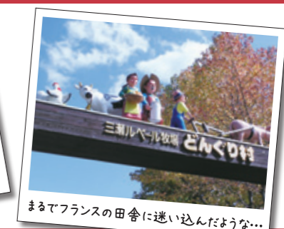
まるでフランスの田舎に迷い込んだような...