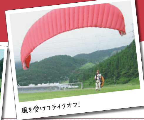
風を受けてテイクオフ!

◎キャンセルや人数の変更等は、前日の午前中までにご連絡ください。 ◎悪天候により、両日とも催行できない場合、料金は返金いたします(スポーツ安全保険代除く)。 ◎長そで、長ズボンの動きやすく汚れてもよい服装でご参加ください。また、ジャンパーなど羽織れる上着、手袋、足首まで保護する靴をご持参ください。10kgの装備を背負っていただきます。 ◎自動販売機は利用できません。飲み物などは各自でご用意ください。