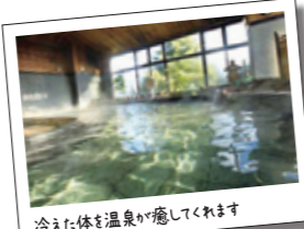
冷えた体を温泉が癒してくれます

おいしさに加え、お客様の健康づくりにもお役にたてるよう、自社農園・地元で採れた安全、安心な新鮮野菜をふんだんに使った約60種類の料理・デザート・ドリンク等をお楽しみいただけます。冷えた体を温泉であたため、健康バイキングで旬の食材を存分に味わってください。定員に限りがありますので、お早めにご予約ください。