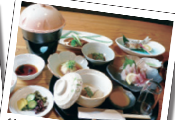
新鮮な地元食材を使った会席料理(料理一例)