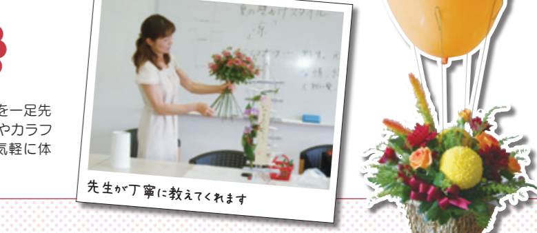
先生が丁寧に教えてくれます

佐賀県最大のイベント「佐賀国際バルーンフェスタ」を一足先にお花で楽しめる体験です。空に浮かぶバルーンをイメージし、生花やカラフルな風船、県産みかんを使って楽しくアレンジ。初めての方でも気軽に体験できるので安心です。