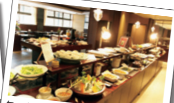
旬の有機栽培野菜を使った約60種類のバイキング