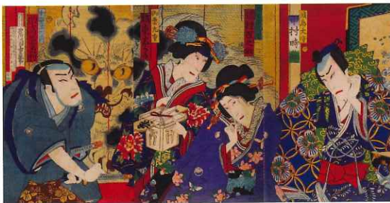
(薩摩奥妖猫奇談) 守川周重筆 (佐賀県立図書館蔵)