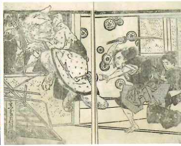
実録文庫佐賀怪猫奇談 東風軒半馬著 (佐賀県立図書館蔵)