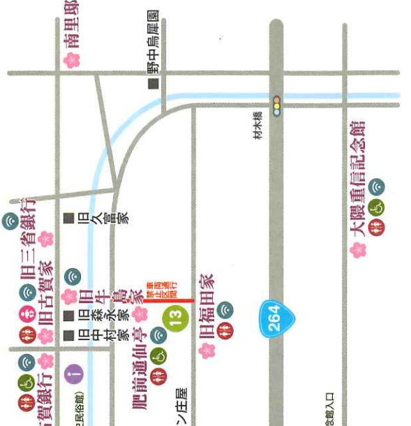
佐賀城本丸歴史館