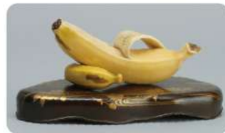
※バナナの置物は 9月3日～9月29日 公開