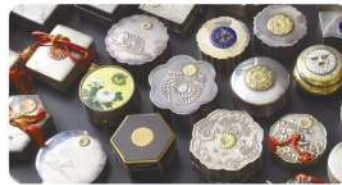
御慶事の記念品 ボンボニエール