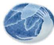
佐賀藩が誇る 鍋島焼