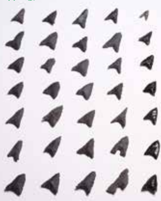
石 鎌 サヌカイトと黒耀石 (右列)