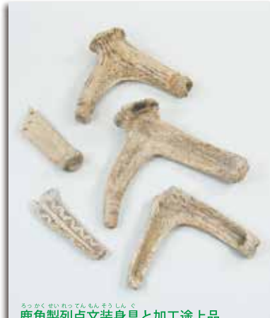
鹿角製列点文装身具と加工途上品