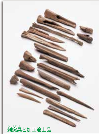
刺突具と加工途上品