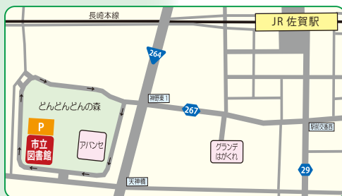
▲佐賀市立図書館 <佐賀市天神三丁目 2-15> ◎JR 佐賀駅から徒歩約 15分

◀原石を割って製品になる前の素材を「剥片」、剥片のもとになる石のかたまりを「石核」と言う。剥片から石鎌等の製品が製作された。