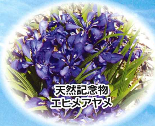
天然記念物 正ヒメアヤマ