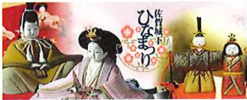
佐賀市観光協会 流通課 古賀