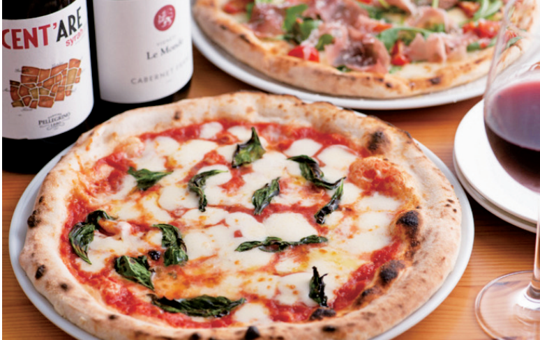
『マルゲリータ』1,760 円。佐賀県産トマトのフルーティーな甘みと酸味が特徴。冷凍ピッツァも販売